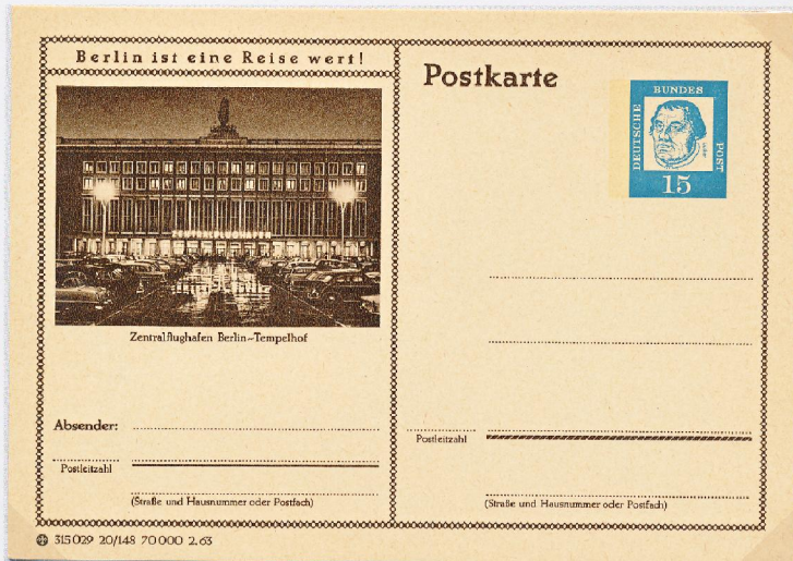
Voorgefrankeerd propaganda briefkaart - Berlijn is een reis waard - Uitgegeven in 1963 - met afbeelding van de luchthaven van Tempelhof

Via de luchthaven van Tempelhof (USA) en Gatow (GB) werden 278228 vluchten uitgevoerd en gemiddeld werd dagelijks 8000 ton vracht aangevoerd. Na 324 dagen wordt op 12 mei 1949 de blokkus opgeheven.